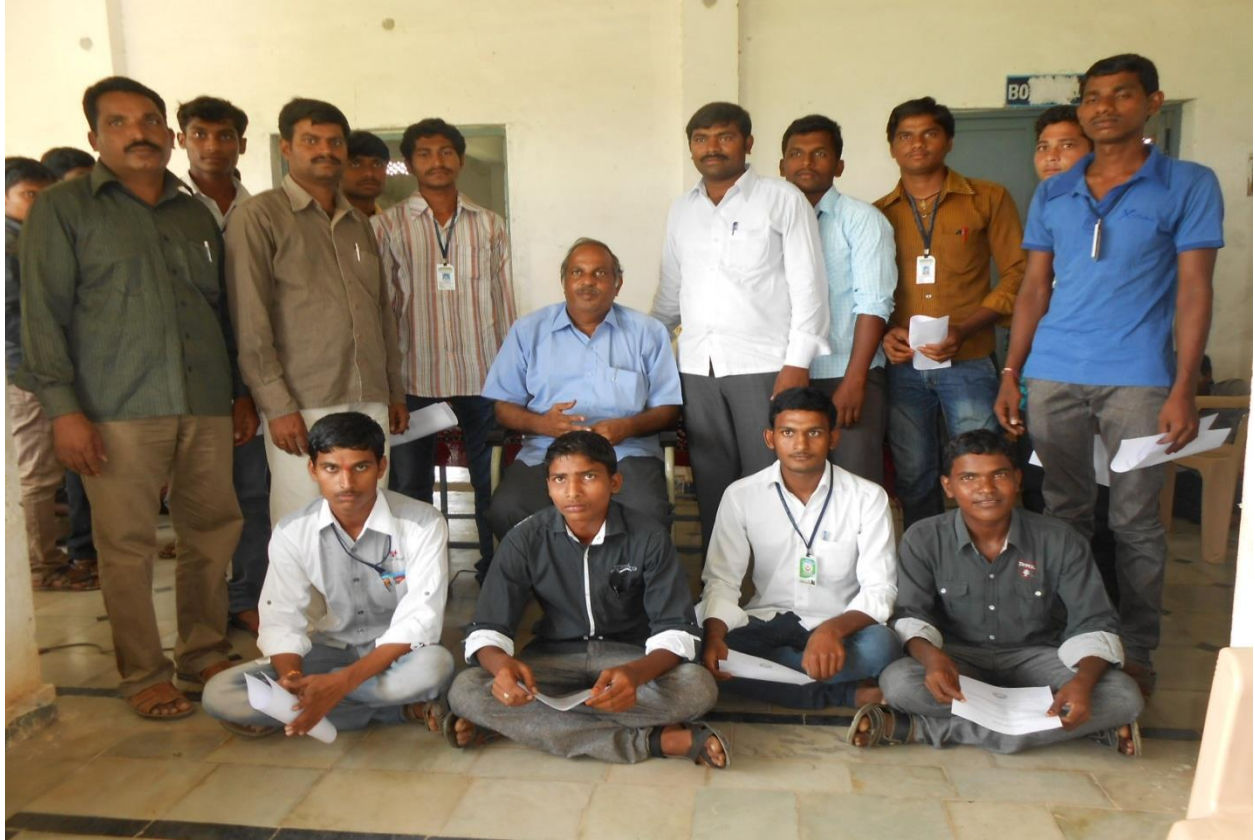
Group Photo of Principal, co-ordinator, mentor with selected students