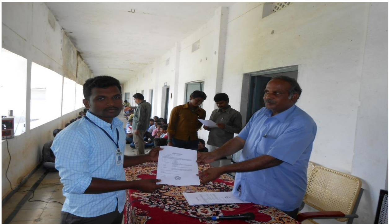
The appointment letters issued to students by the principal.