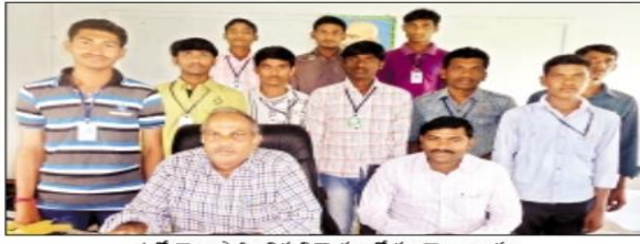
ఉద్యోగాలు సాధించిన విద్యార్థులతో కళాకాల బృందం

శివవెళ్ల : కృషి, పట్టుదల ఉంటే విద్యార్థులు ఉన్నత శిఖరాలను అధిరోహించ వచ్చు. ఈ సూత్రాన్నే కొందరు విద్యార్థులు వంటబట్టి చూసున్నారు. డిగ్రీ చదువుకుంటూనే ఉజ్వల భవిష్యత్తుకు ప్రణాళికలు రూపొందించుకున్నారు. చదువుతోపాటు విషయ నైపుణ్యం, భావ వ్యక్తీకరణ పరిజ్ఞానం సాధించి ప్రైవేటు ఉద్యోగాలకు ఎంపికయ్యారు.